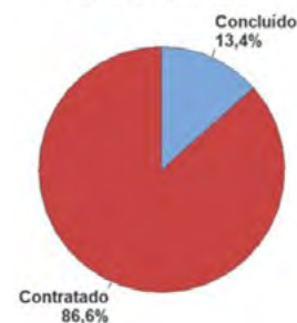
Gráfico de Setores de ANO